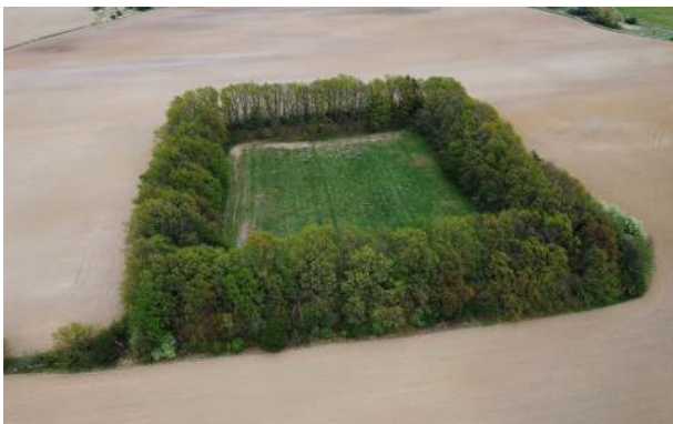
Šance u Skříple. Památka na keltské osídlení Hostomického úvalu.

Zajímavosti na stezce: osovský zámek a pivovar (1), park s památnými stromy, dříve