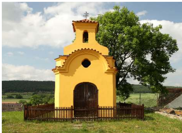
Památkově chráněná pozdně barokní kaplička v Lážovicích z konce 18. století.

jízdárna (2), kdysi cihelna, dnes požární nádrž s možností koupání (3), kaple v Osovci (4), železniční zastávka Vižina (5), obec Vižina (6), pomník padlých (7), začátek Ptačí stezky (8), kaštanová alej a lom Bílé hlíny (9), památné lipky z roku 1919 (10), památná lípa 2018 (28) a obnovená alej "Lipůvka" (33).