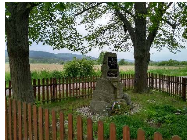
Památník na padlé vojíny Velké války 1914-18 na jižním okraji obce Vižiny.